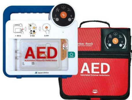
AED (自動体外式除細動器) カーディアックレスキュー「RQ-5000」

当社は、医療現場に対して長年にわたり、医療機器を提供してまいりました。その経験を生かし、一般の方も利用できる AED 等の医療機器の普及を図ることで、日常生活のリスクに備え、より安心して生活を行うことができる環境作りをサポートしてまいります。